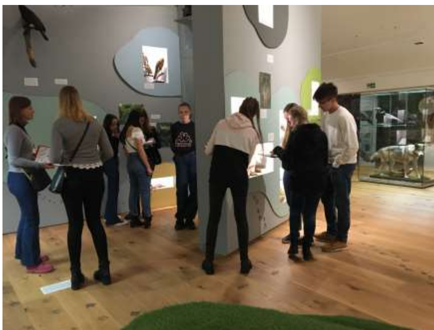
VČM - Kdy jste je viděli naposledy?