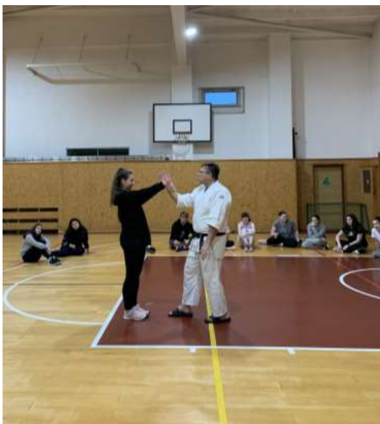
Základy sebeobrany na DM

Celoročně – Aquacentrum, kondiční cvičení, posilovna v krytu, celoroční soutěž „Lovení perel“- motivační hra k posílení aktivity na DM.