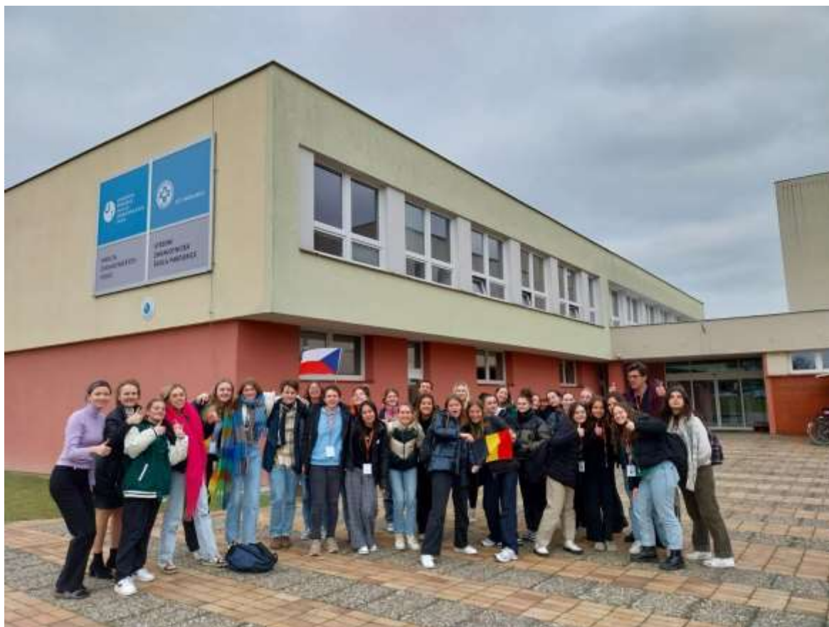
Výměnný pobyt Belgie