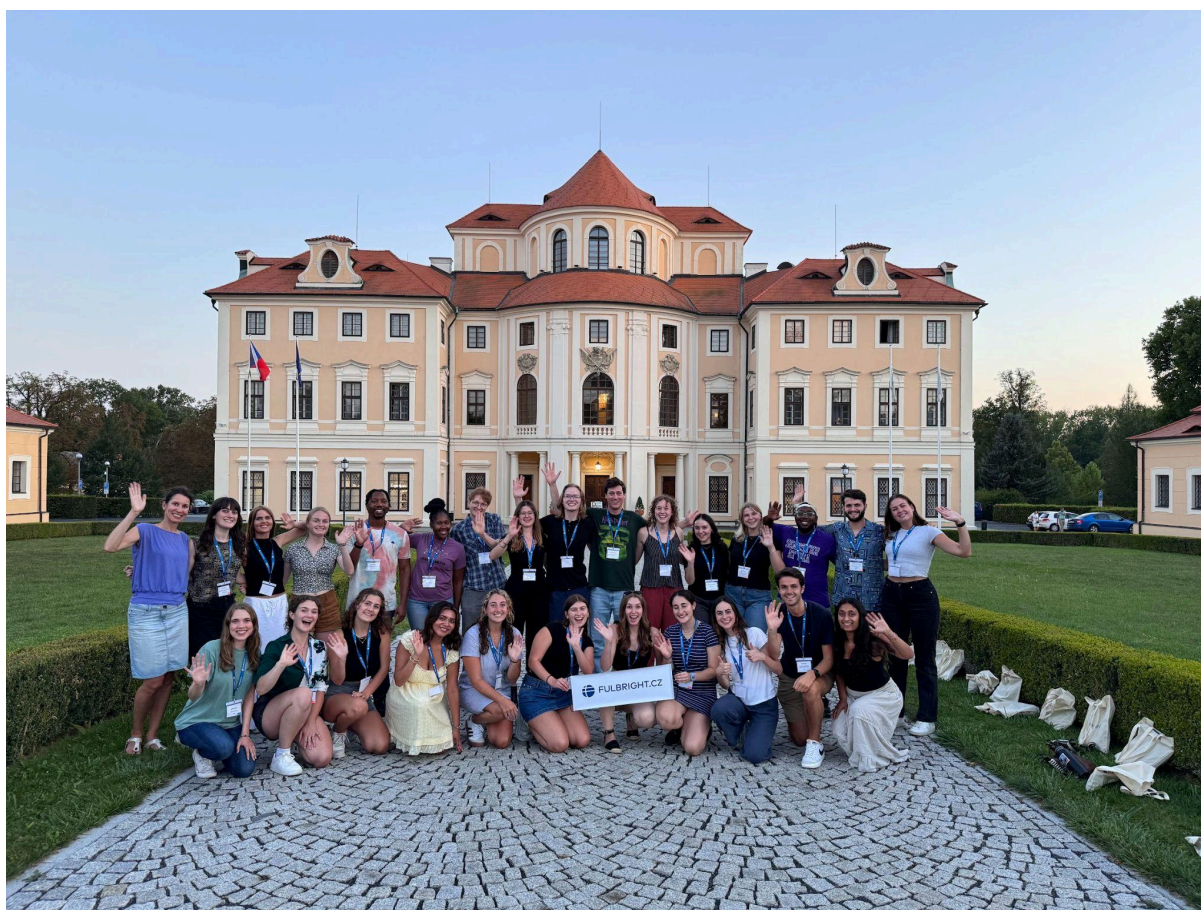
Obr. 1: Asistenti na přípravném školení na Zámku Liblice, 28. srpna 2024.

Praha, 2. září 2024 - V novém školním roce na středních školách po celé České republice pomůže s výukou angličtiny 25 stipendistů Fulbrightova programu. Mladí Američané, často čerství absolventi bakalářských nebo magisterských programů, do České republiky jezdí asistovat středoškolským učitelům již od roku 2005 a celkem se jich v tomto programu vystřídalo už téměř 300. Asistenti se kromě výuky angličtiny zapojují do života svých hostitelských měst. Nabízejí odpolední konverzační kurzy pro studenty, učitele a další zájemce. Někteří zpívají v místním sboru nebo kapele, sportují se studenty, vedou divadelní kroužek nebo pomáhají v neziskových organizacích. Ve spolupráci s českými kolegy se zaměřují na doučování studentů, kteří potřebují individuální pozornost.