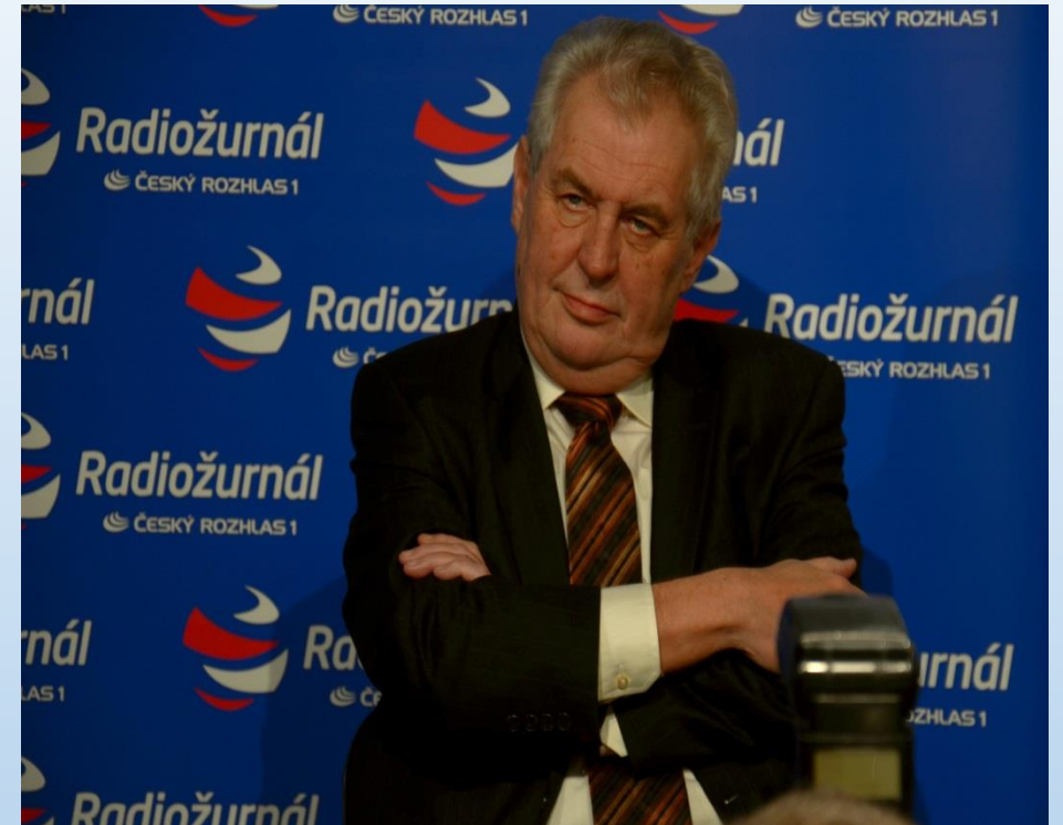
První prezident zvolený v přímé volbě Miloš Zeman – 2014.