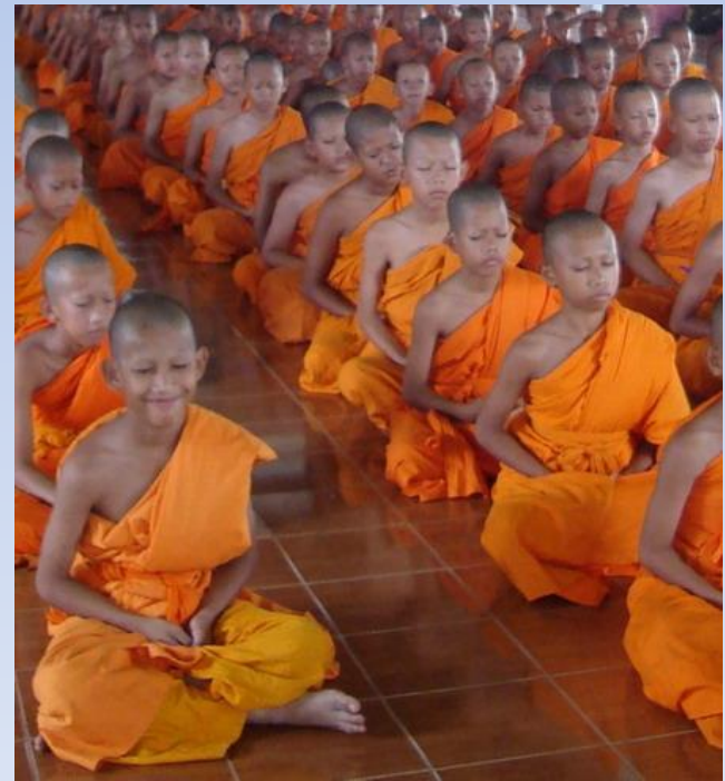
mladí mniši a koncentrace před modlitbou