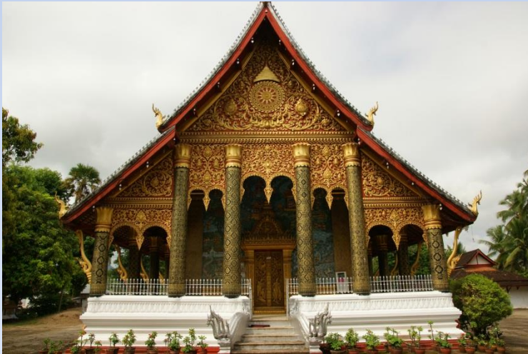
Chrám Wat Peapat v Kambodži