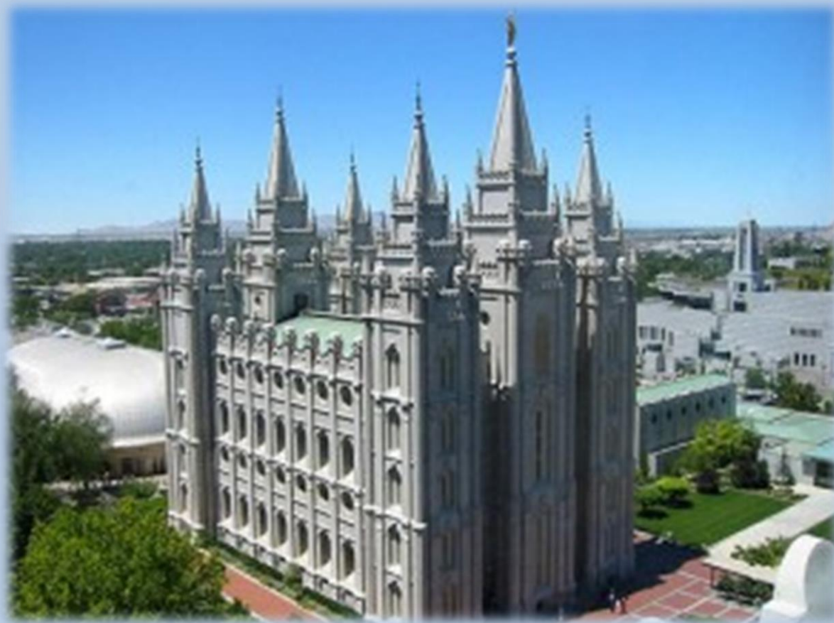
Mormonský chrám – Salt Lake City, Utah, USA